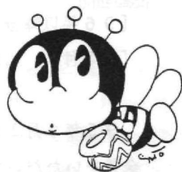
生涯学習のマスコット “マナビイ”