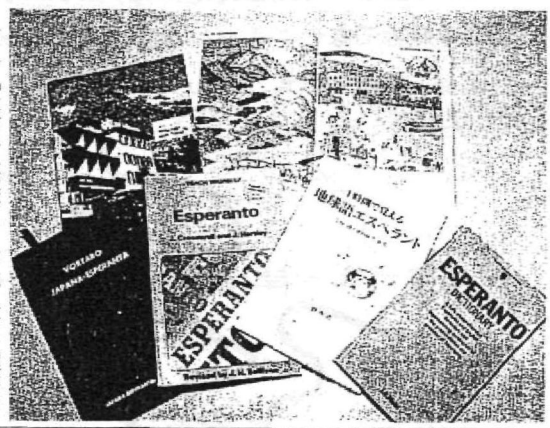
エスペラント語の教本など

ランドはロシア領でポーラ ンド人、ロシア人、ドイツ 人が住み、民族間の争いが 多い地域で、「どの国にも 属さないやこい共通語が あれば」との思いが込めら れていた。