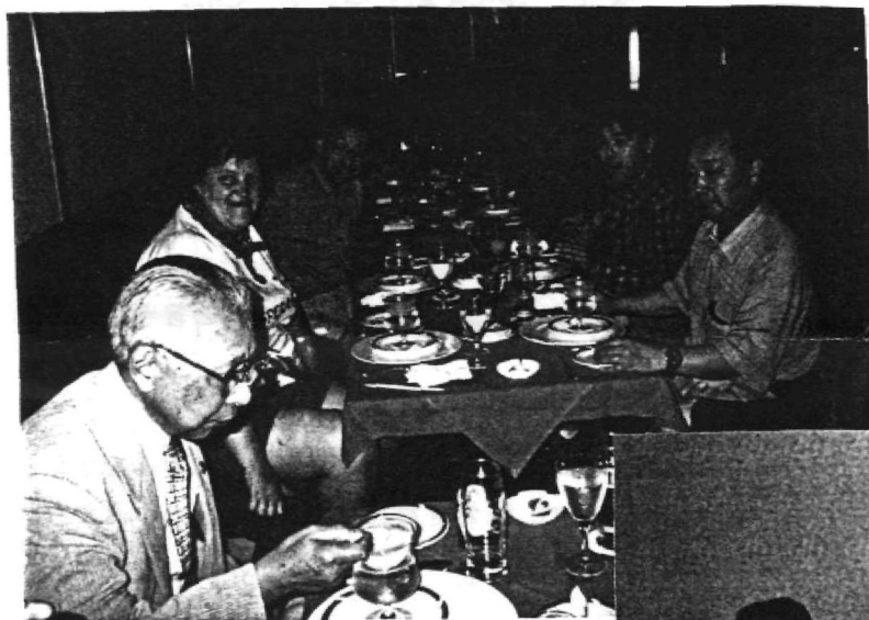
札幌での歓迎会（参加者は20名程度）