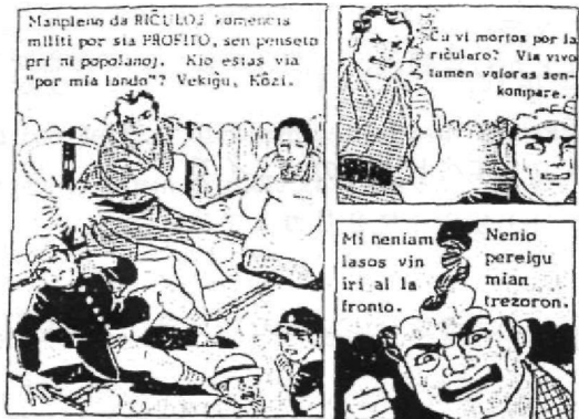
エスペラント語に翻訳された「はだしのゲン」

エスペラント語の最大の 目指す「ブラハ宣言」を 長所は民主的な言葉である 表しています。国境の壁が 低くなりつつある今、民族、 は少数派の言語と文化を尊 国家に属さないエスペラン 重し、補助的に使っていま ず。 昨年七月にアラハで開か れた世界エスペラント大会 には五月、インターネットに では、民主的な言語教育を 会とエスペラント語とい