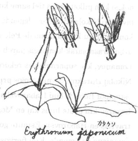
カタクリ Erythronium japonicum