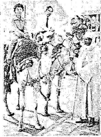
昭和五十一年、エジプト・ギザのピラミッドを背景に亡き妻と

時が来た。五十一年の最初の訪ソの時、外国人が入れる都市は十カ所に限られていました