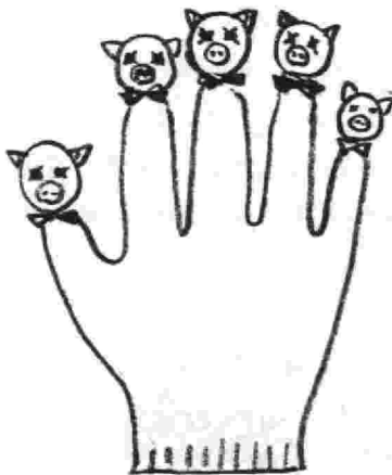
「劇団タヤけ」の軍手指人形

*5名が受講中(全員女性)。受講者の顔ぶれは札幌E会会員の親類(2名)、関西で受講再学習、看護婦、翌年のUKを目指した再学習者など。