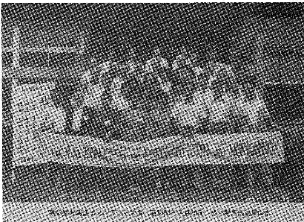
第43回北海道エスペラント大会、昭和54年7月29日、於、朝里川温泉山荘