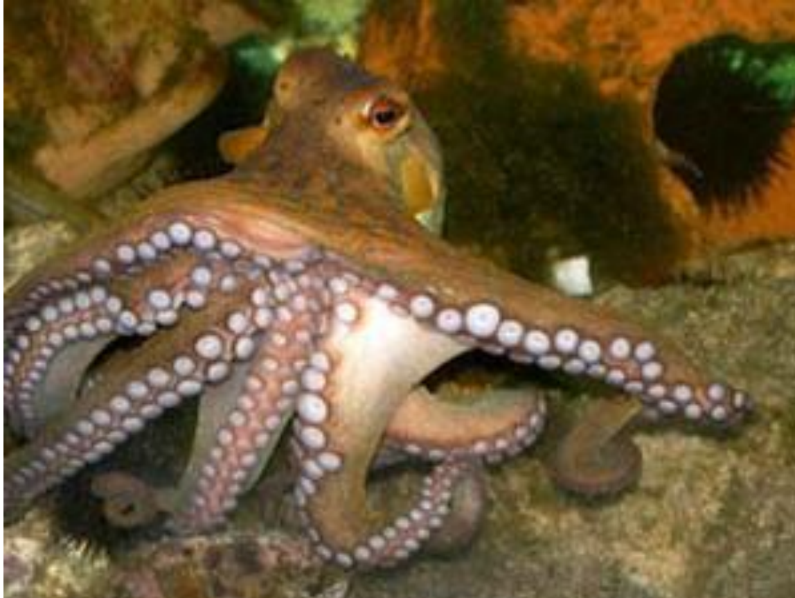
Oktopuso (latine: Octopus vulgaris)