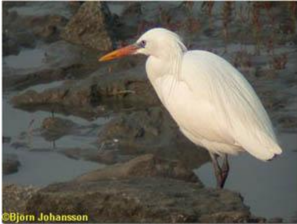
Ergeto (latine: Ergetta eulophotes )