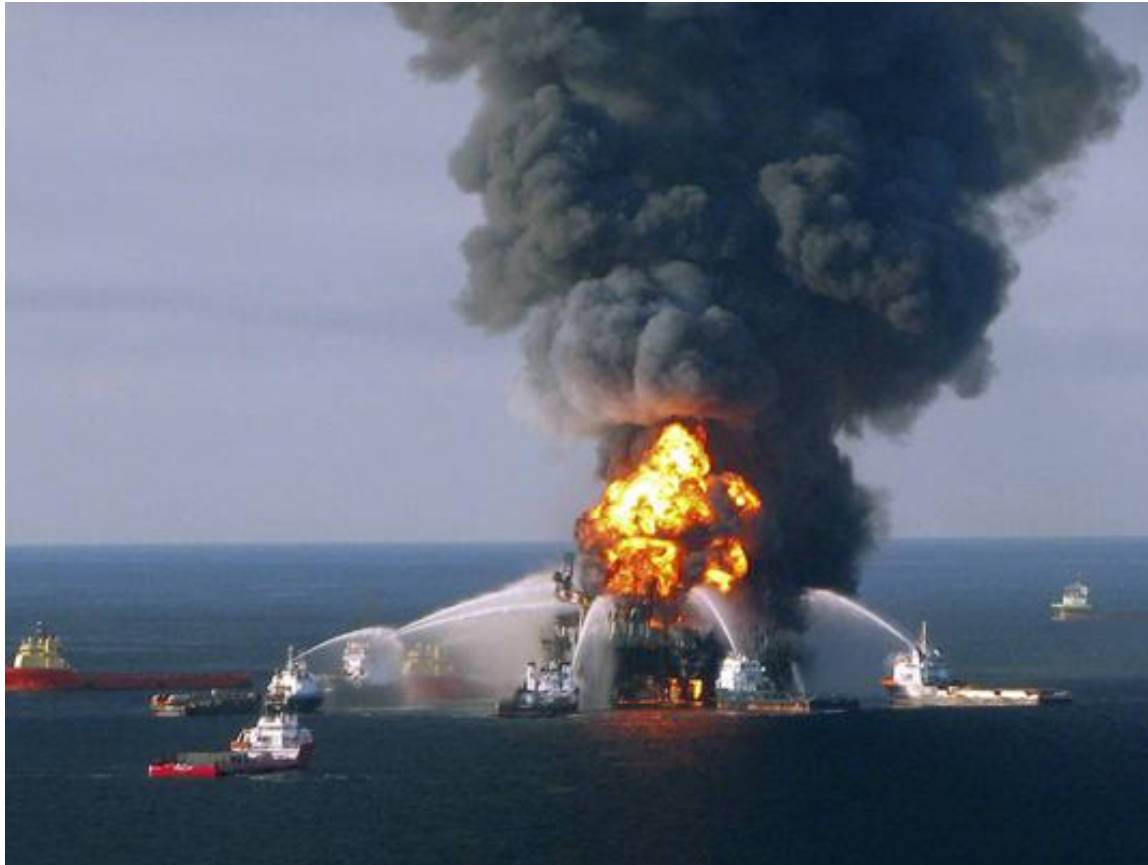
Fajras ŝipo kun nafto (Pacifiko)