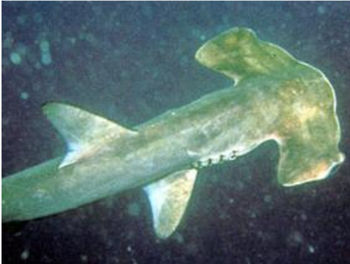
Speco de șarko (latine: Sphyrna zygaena )