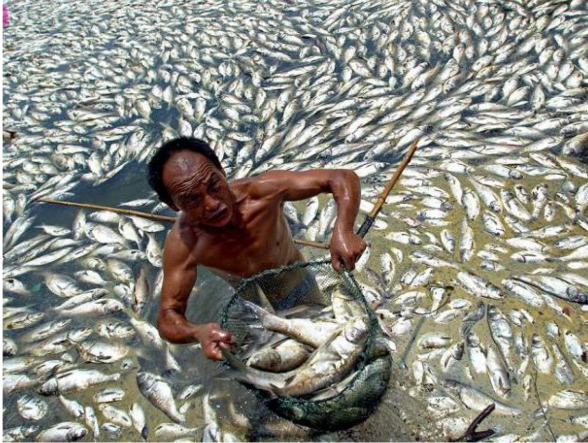
Lago Guankiao en Ŭan (Ĉinio)