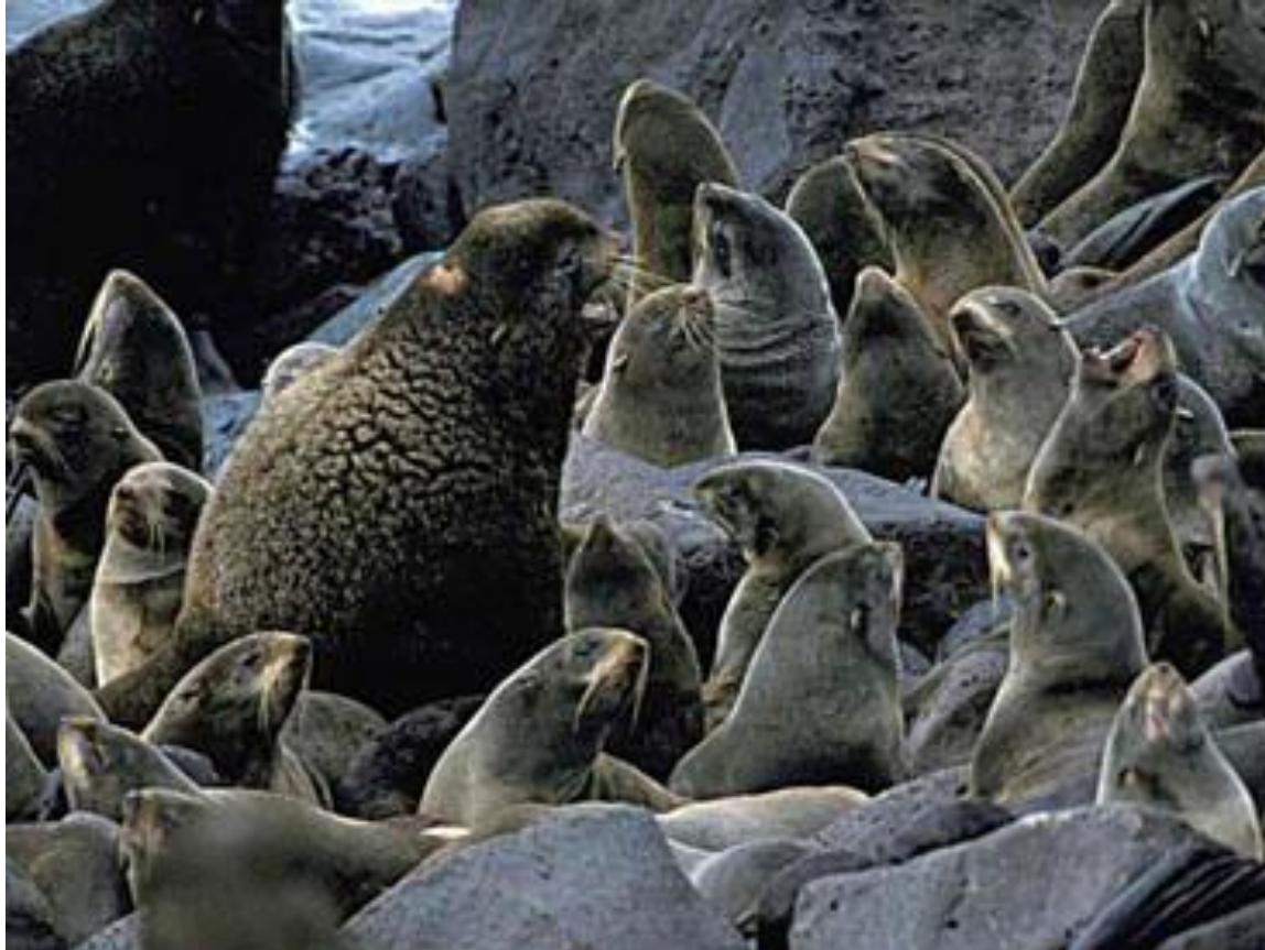
Fokenoj (latine: Callorhinus ursinus )