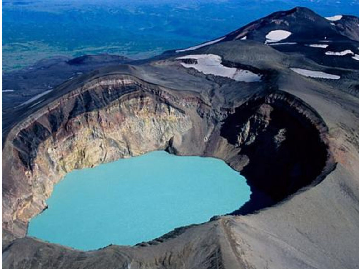
Kamçatko - unu lago en vulkano