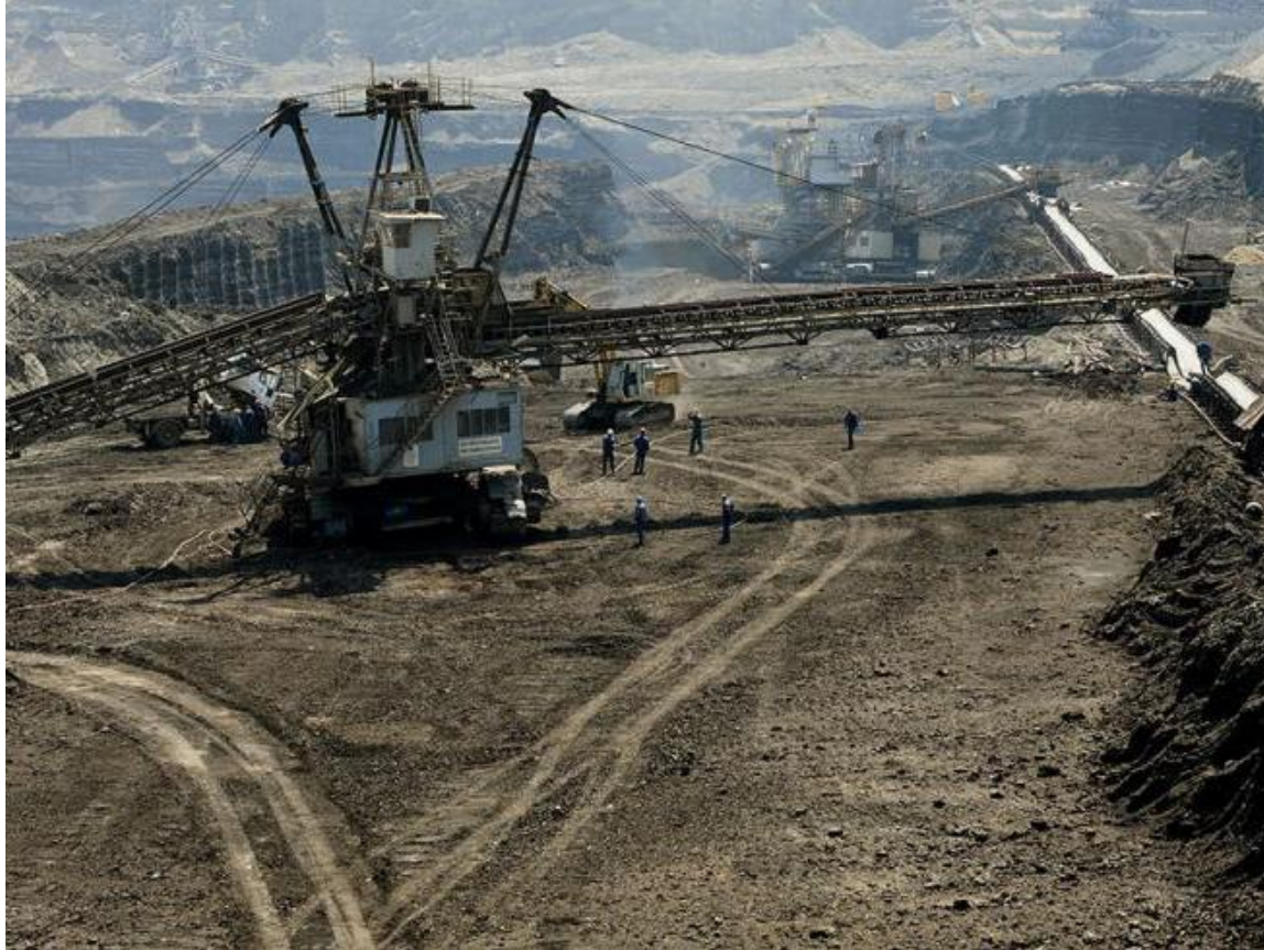
Produktado de karbo en Kosovo (apud Albanio)