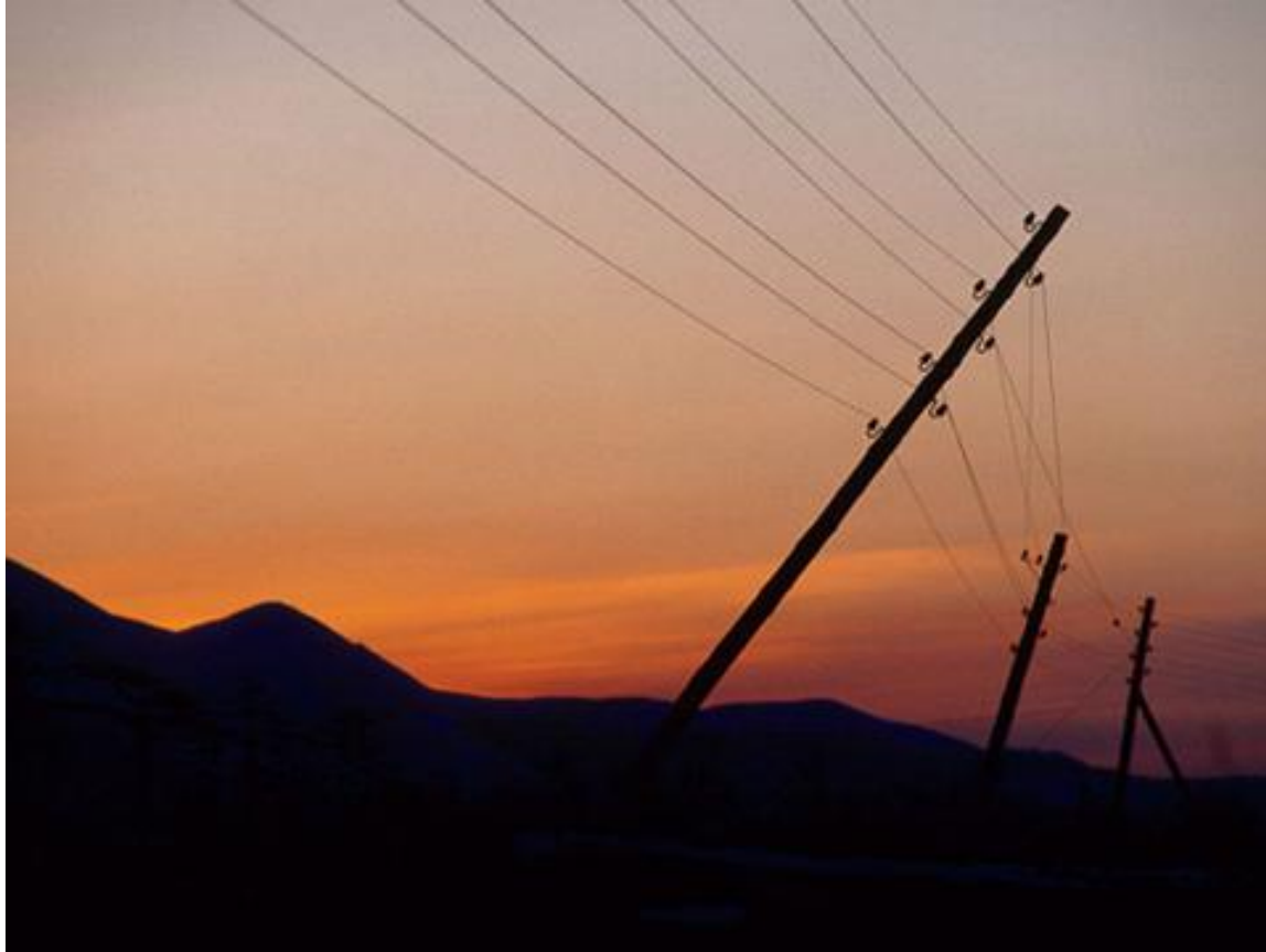
Telefona linio (En Magadano, Rusio)