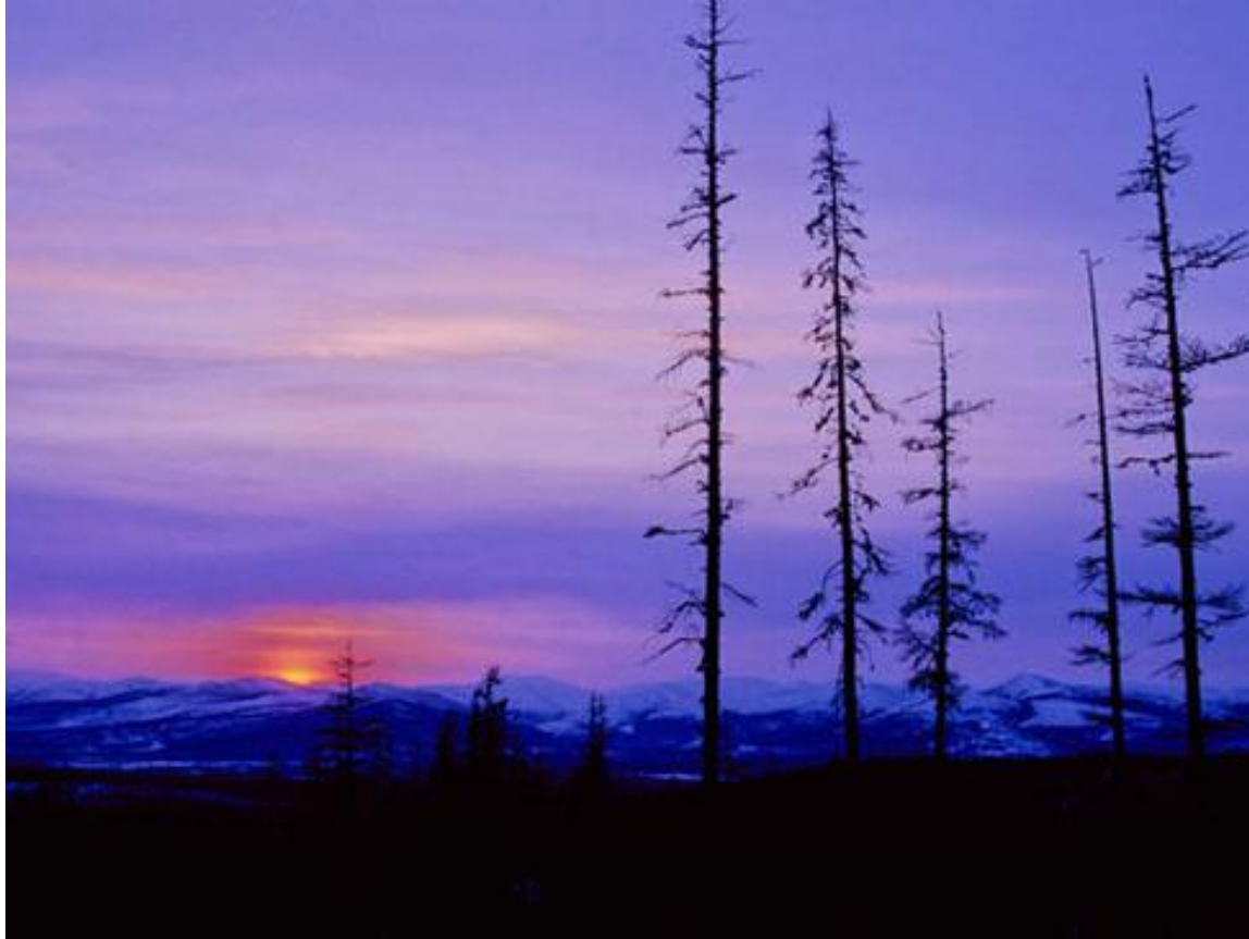
Sunsubiro dum vintro en montoj