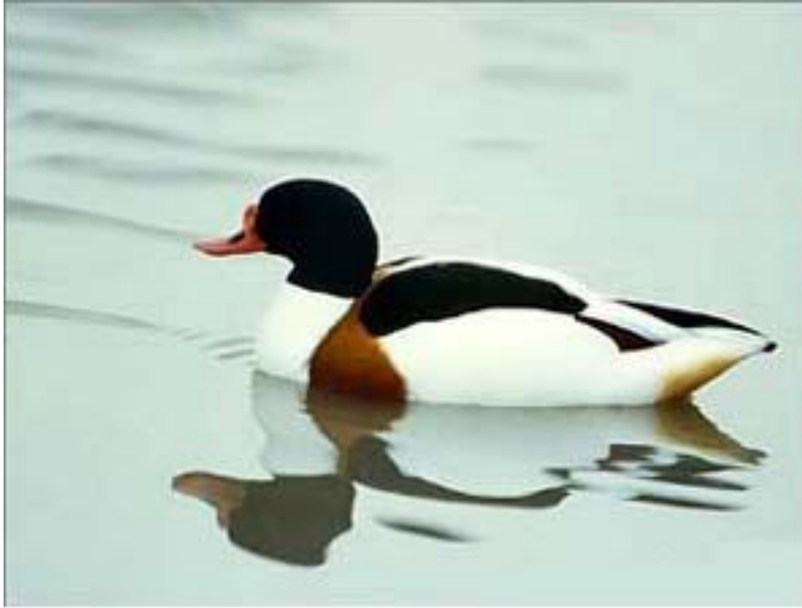
Speco de anaso (latine: Tadorna tadorna )