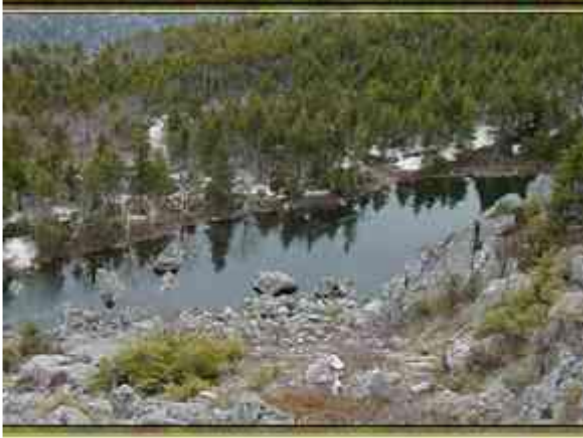
Êmara provinco: suda parto, lago sur la monto Vorobei (jap. Suzume)