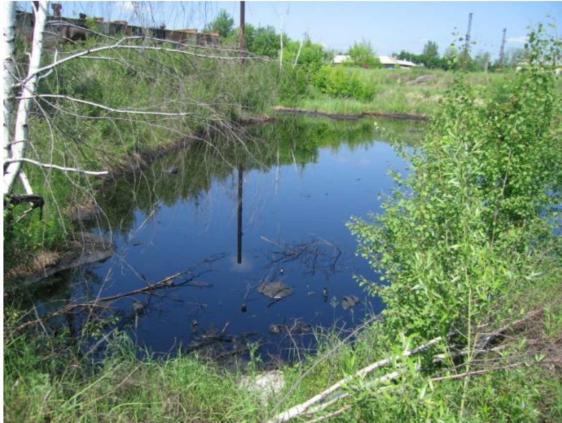
Lago plena de petrolo (Centra Rusio)