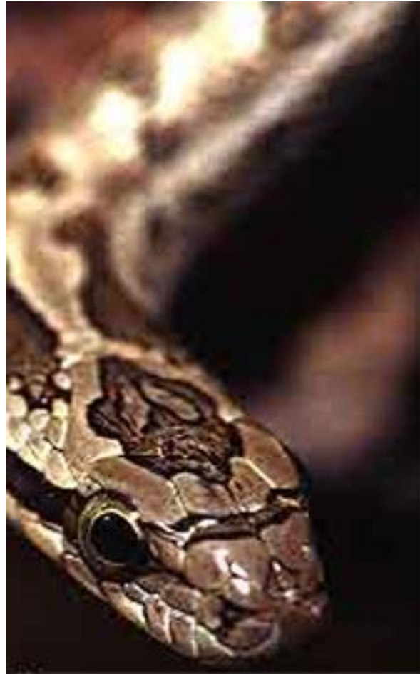
Speco de serpento (latine: Elaphe dione)