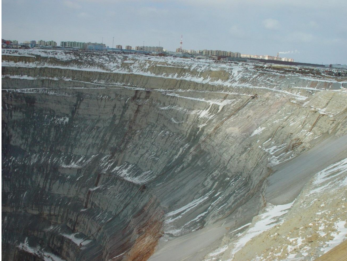
Diamanto-minejo (Jakutio, Rusio)