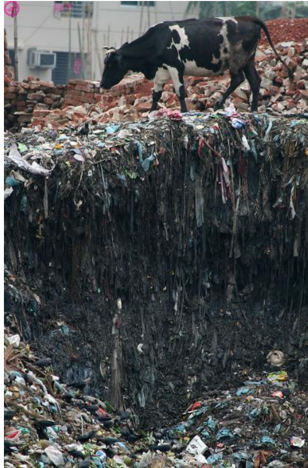
Angulo en la urbo Dakka (Bangladeño)