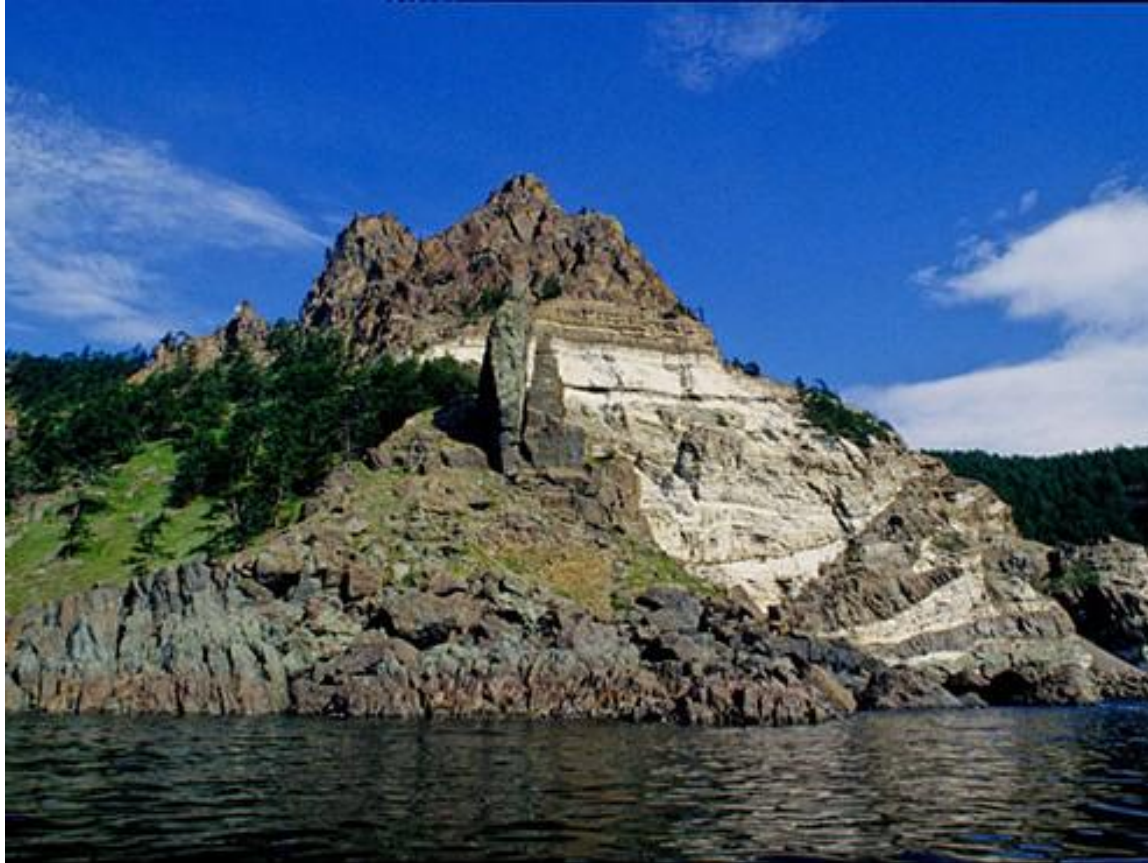
Rokvando êe Oňocka Maro