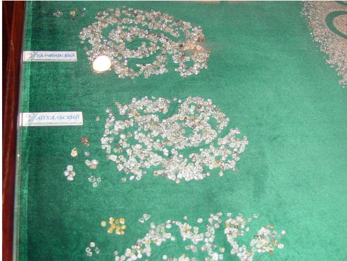
Jenas la produktaĵoj: Diamantoj el Jakutio