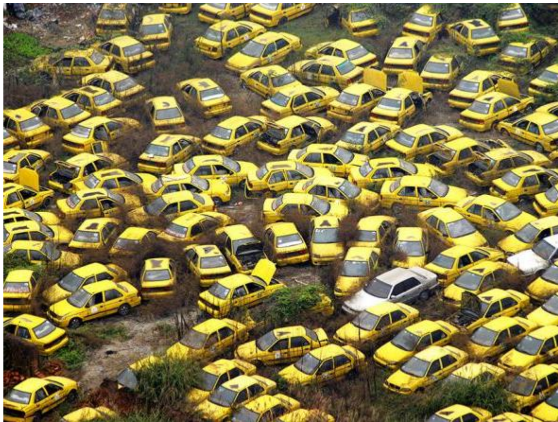
Tombejo de nenecesaj taksioj (Ĉinio)