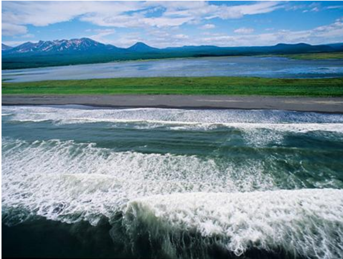
Panorama de kvietaj ondoj ĉe marbordo