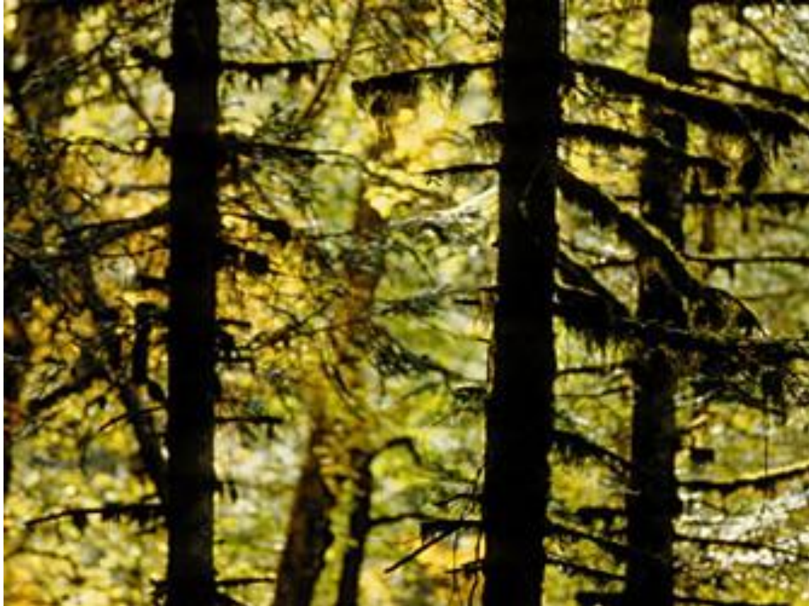
Ussuri arbarego (ruse: Tajgo)