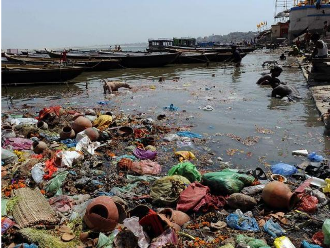
La Rivero Gango (Hindio)