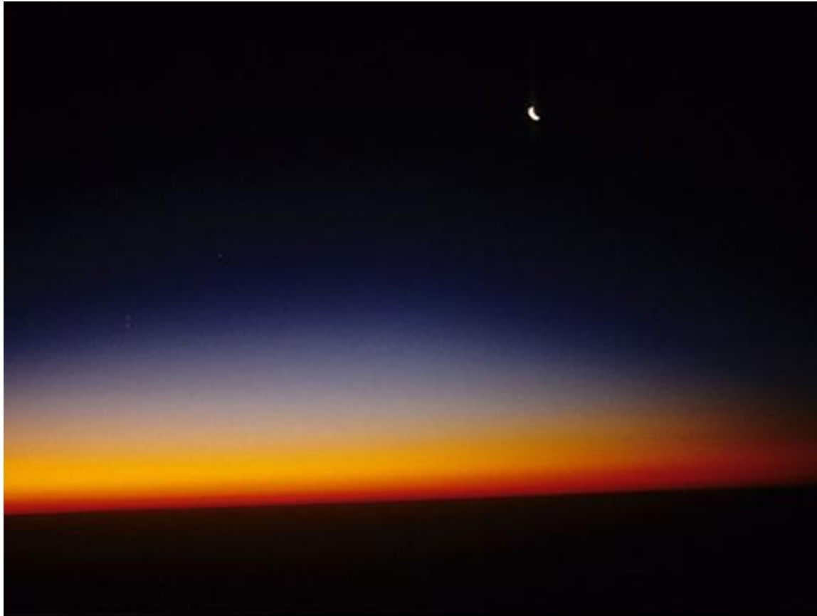
Sunleviço en Çemara provinco