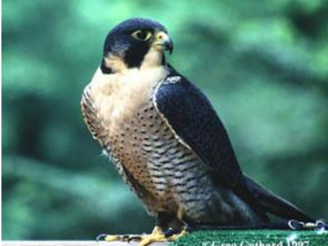
Falko (latine: Falko peregrinus)