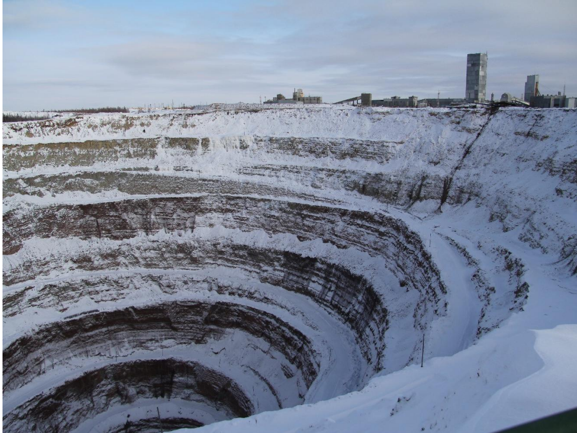
Vintro en la sama diamanta minejo (Jakutio)