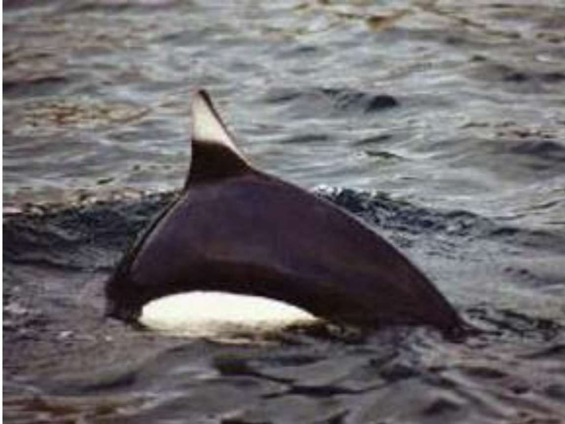
Speco de delfeno Foko (latine: Phocaenoides dalli )