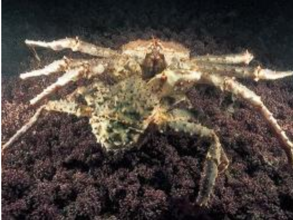
Kraboj êe Kamâtko ( japane: Tarabagani)