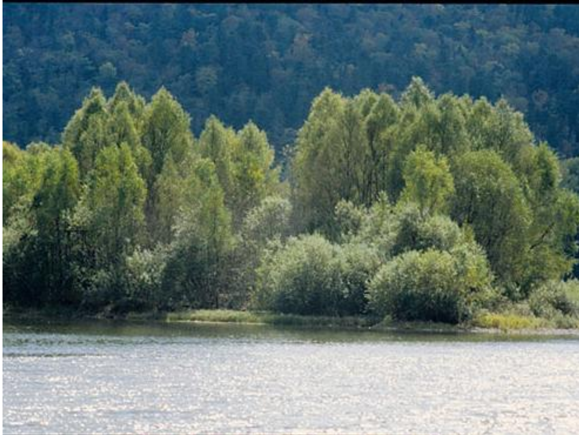
Bordo de Ussuri rivero