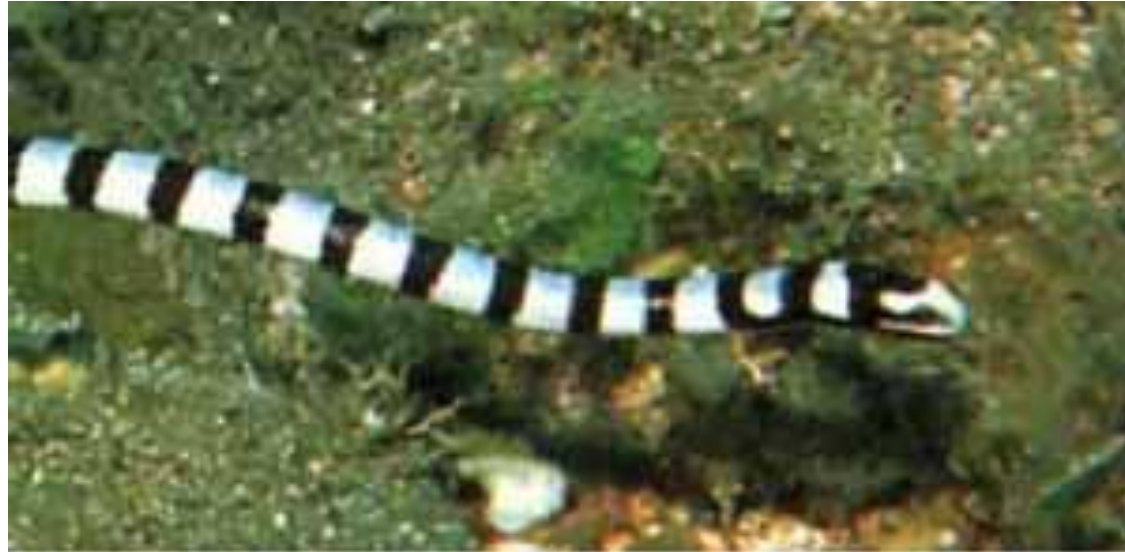
Speco de serpento (latine: Laticauda semifasciata )